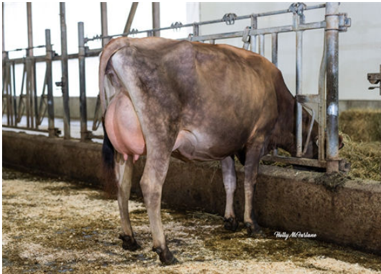
BRIDON J VISION

HEARTLAND IRWIN TEXAS GUIMO SPECTACULAR JOELLE VG-87-2YR-CAN 8* MAACK DAIRY SPECTACULAR FERMAR PARAMOUNT JOY EX-95%-8YR-USA ROCK ELLA PARAMOUNT EARLY RISE FIRST PRIZE JESSIE SUP-EX-92-8E-CAN 2*