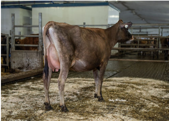
BRIDON J VISION